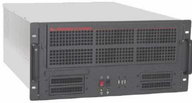
TVC5401 ビデオコントローラ シングルプロセッサSBCと 18スロットバックプレーンを実装